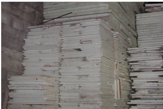
Photo: Used EPS boards