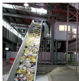
Foto: Impianto di selezione di rifiuti