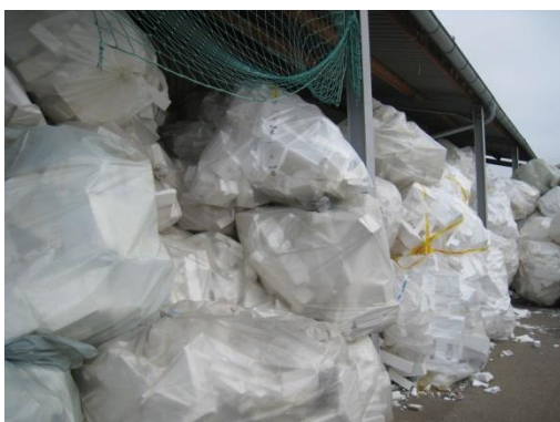
Photo: EPS recycling bags