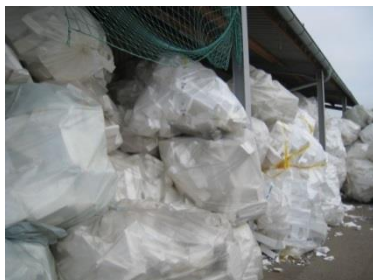
Foto: Sacchi di EPS da riciclare