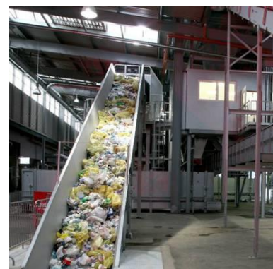
Photo: Waste sorting plant